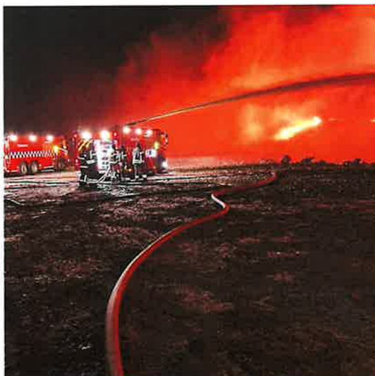
Innsats på Skjerkøya.

Skjerkøya Brannen på Skjerkøya utfordret avdelingen. GBR var i tung innsats døgnet rundt i over en uke, og ansatte fra alle avdelinger deltok i arbeidet.