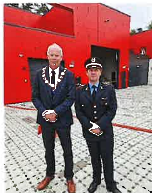
Ordfører i Bamble og brann- og redningssjefen i GBR under åpningen av ny brannstasjon.

Morten Meen Gallefos Brann- og redningssjef