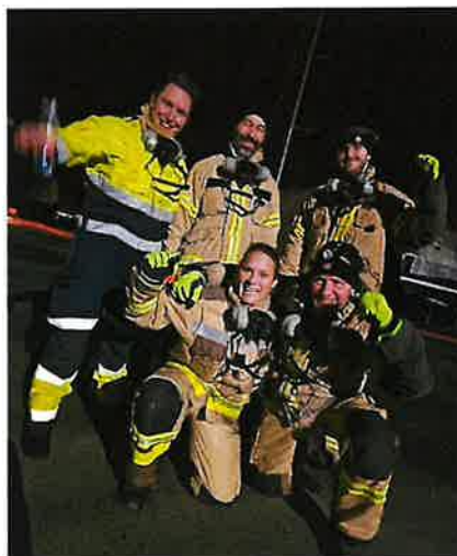
Brannforebyggere i innsats på Skjerkøya

Alle mann til pumpene En stor andel av avdelingens ansatte bidrar som reservestyrker for beredskapsavdelingen ved store og ressurskrevende hendelser. Flere brannforebyggere med dokumenterbar grunnkompetanse deltok i slukningsarbeidet av den omfattende brannen i dekkdeponiet på Skjerkøya. En krevende innsats med stort behov for å benytte alle disponible ressurser. Slike store innsatser med involvering fra flere avdelinger bidrar sterkt til å styrke samhold mellom avdelinger. Samarbeidet skaper felles forståelse for forebyggende arbeid på tvers av avdelinger og er en motivasjonsfaktor for å nå målsettingen med forebyggende arbeid, men også i innsats under en hendelse.