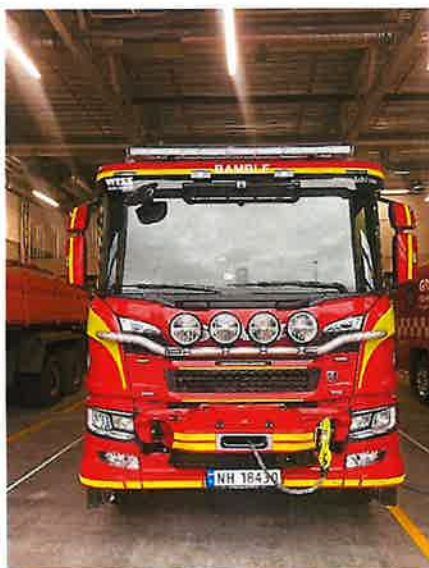
Mannskapsbil Bamble.

Investeringene er finansiert med bruk av lån, i tillegg salg av den gamle mannskapsbilen fra Brevik og en båt i Kragerø.