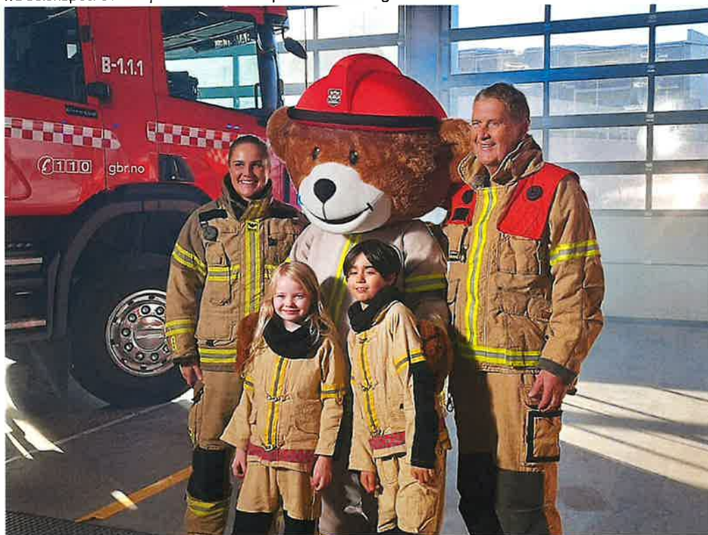
Bjørnis-innspilling på Bamble Brannstasjon.

Bjørnis I oktober ble det spilt inn 14 episoder av Bjørnis på brannstasjonen i Bamble med skuespillere fra selskapet. Disse episodene blir vist på NRK i 2025 og 2026.