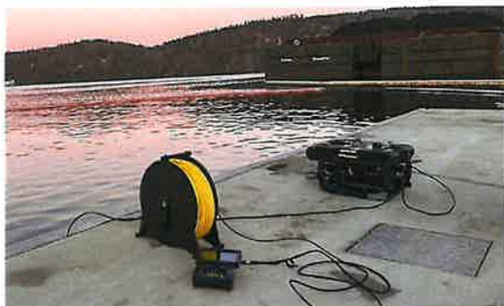
Undervannsdrone (ROV) brukt for kartlegging av utslipp Skjerkøya.