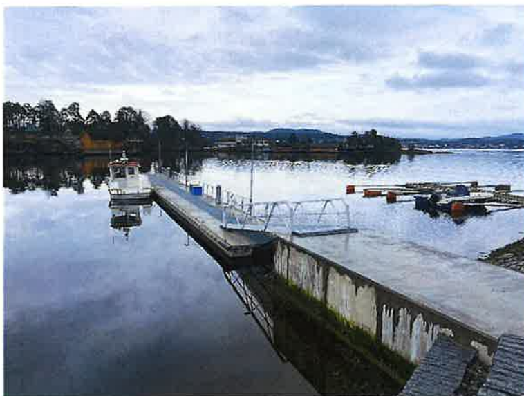
Anlegg for sjørettet innsats i Bamble.

Konsekvensen av ovenstående er at både bruk av lån og kompensasjon for merverdiavgift også har stort avvik mot budsjett.