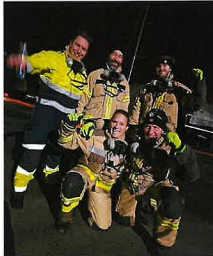
Brannforebyggere i innsats på Skjerkøya

Alle mann til pumpene En stor andel av avdelingens ansatte bidrar som reservestyrker for beredskapsavdelingen ved store og ressurskrevende hendelser. Flere brannforebyggere med dokumenterbar grunnkompetanse deltok i slukningsarbeidet av den omfattende brannen i dekkdeponiet på Skjerkøya. En krevende innsats med stort behov for å benytte alle disponible ressurser. Slike store innsatser med involvering fra flere avdelinger bidrar sterkt til å styrke samhold mellom avdelinger. Samarbeidet skaper felles forståelse for forebyggende arbeid på tvers av avdelinger og er en motivasjonsfaktor for å nå målsettingen med forebyggende arbeid, men også i innsats under en hendelse.