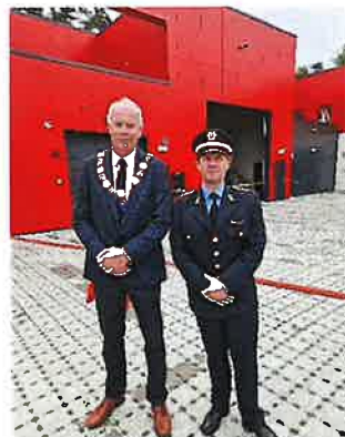
Ordfører i Bamble og brann- og redningssjefen i GBR under åpningen av ny brannstasjon.

Morten Meen Gallefos Brann- og redningssjef