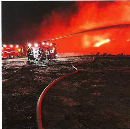
Innsats på Skjerkøya.

Skjerkøya Brannen på Skjerkøya utfordret avdelingen. GBR var i tung innsats døgnet rundt i over en uke, og ansatte fra alle avdelinger deltok i arbeidet.