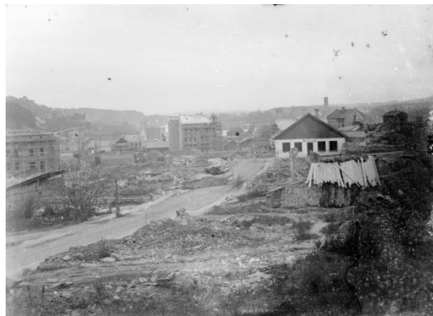
På bildene under ser du hvordan Skien sentrum så ut etter brannen. Fotografiet til venstre er tatt fra Snipetorp. På bildet til høyre har fotografen trolig stått i nærheten av Skistredet, ikke langt fra Ibsenparken, og pekt linsen nedover mot havna.