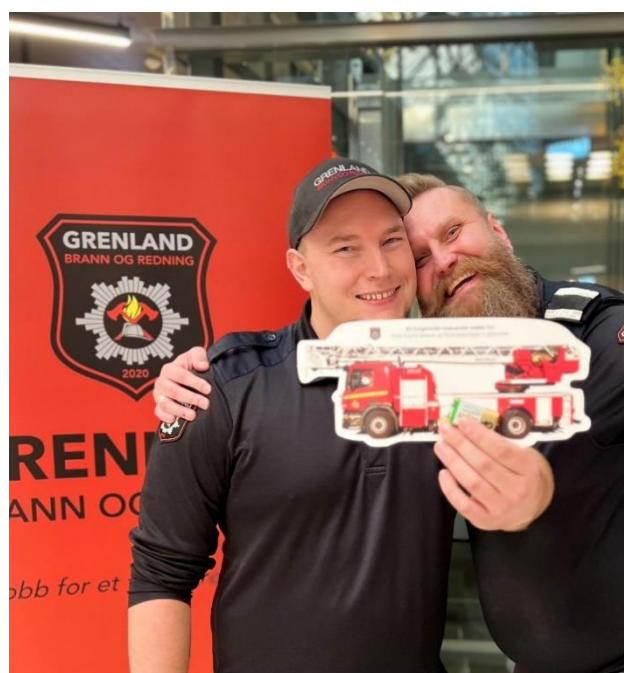
Godt samarbeid på tvers - sammen på stand på røykvarslerens dag.

Feieravdelingen samarbeider godt med øvrige avdelinger og ønsker å bidra til felleskapstankegang i Grenland brann og redning. En stor andel av avdelingens ansatte bidrar som reservestyrker for beredskapsavdelingen ved store og ressurskrevende hendelser. Brannforebyggerne har gjennomført øvelser og blitt benyttet i hendelser i løpet av 2023. Feieravdelingen er representert med tre medlemmer i trygg hjemme gruppe i samarbeid med forebyggende avdeling. Vi har samarbeidet godt med forebyggende avdeling ved kampanjer som aksjon boligbrann, åpen dag og med forberedelser og gjennomføring av røykvarslerens dag 1. desember. Samarbeidet skaper felles forståelse for forebyggende arbeid på tvers av avdelinger og er en motivasjonsfaktor for å nå målsettingen vår.