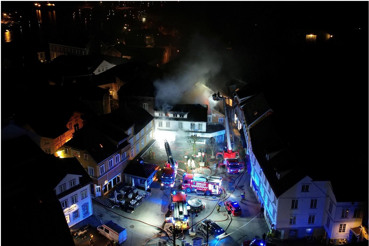
Brann i Kragerø sentrum vinteren 2023.