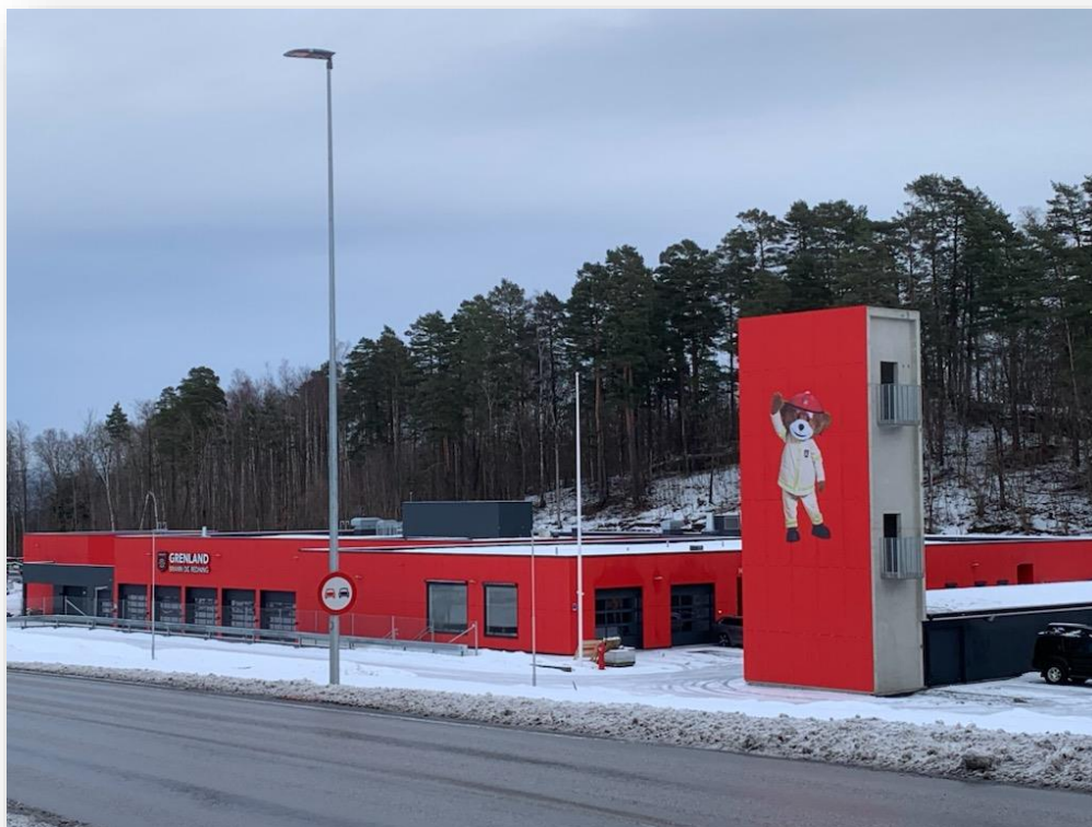
Bamble brannstasjon.

Salg av varige driftsmidler er lavere enn budsjettert. Dette skyldes at mannskapsbilen i Brevik først ble solgt i januar 2024.